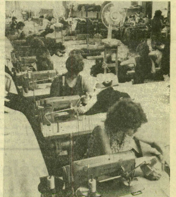
Svájci exportra készülnek a pelerinek a ruházati szövetkezetben