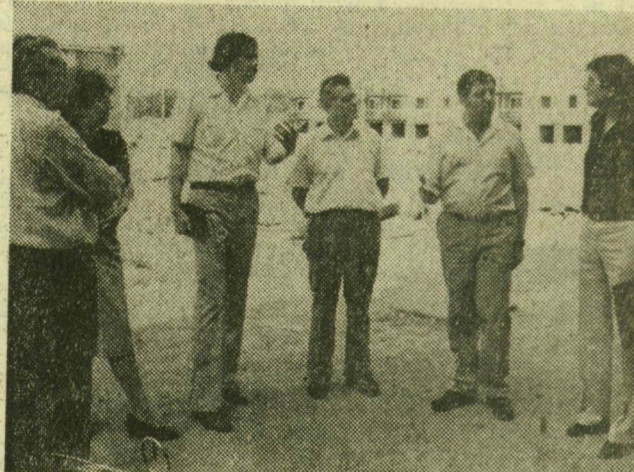
A jugoszláv vendégek az épülő Makkosháza városrészben