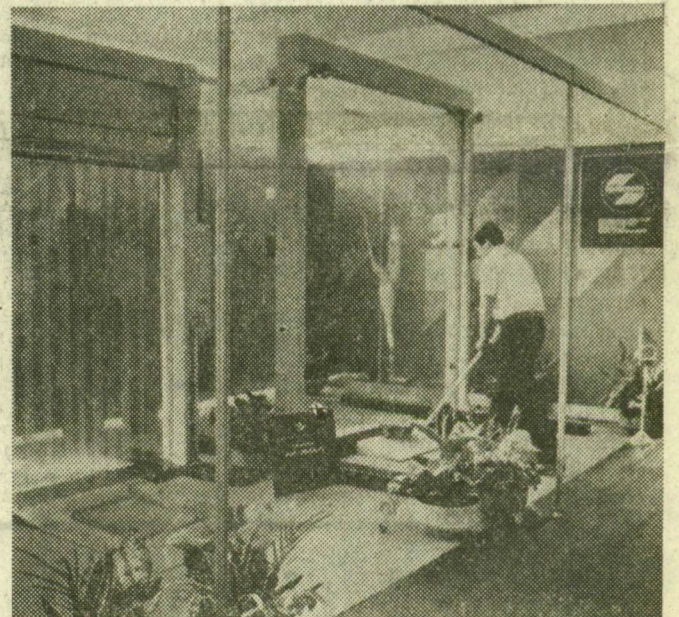
A vásárhelyi Fémtehnika Vállalat újdonságai között is kiemelkedik a kétszárnyú elektro-pneumatikus ipari lengőajtó. Fémtehnika-Sigerist márka svájci licenc és know-how alapján készül. A lengőajtókat ott érdemes beépíteni, ahol nagy anyag- és áruforgalom van. Az ajtók szárnyai automatikusan nyílnak és zárnak, sőt, mint az üveg, olyan áttetszőek, lágy pvc-anyagból készülnek. Ha például egy villás targonca megközelíti, önmagától nyit az ajtó. Az új termék biztosan sikert arat majd, a sorozatgyártását 1984-ben kezdik meg a vásárhelyi vállalatnál

Pénteken folytatódik a szakmai rendezvények, újabb magyar és külföldi kiállítók tartanak sajtótájékoztatót és szakmai bemutatót. Ugyancsak ma, formatervezési nővérdíjakat adnak át, és a legjobb pályamunkákat a Magyar Kereskedelmi Kamara és az ipari tárcák szervezésében kiállításra is bemutatják. (MTI)