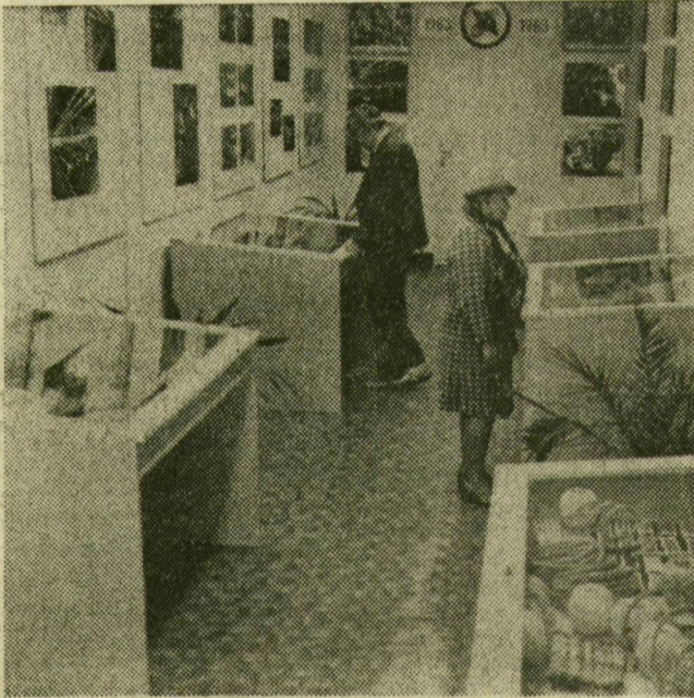
Szeged legújabb múzeuma: A KSZV húsz éve című kiállítás részlete