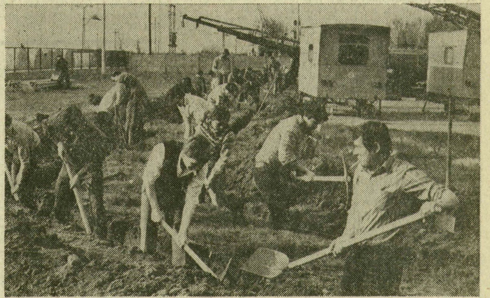
Készül az árok az elektromos és vízvezetéknek, a Városgazdálkodási Vállalat új telephelyén

Szeretni sokféleképpen lehet egy várost. Ugyis, hogy teszünk is érte, hogy szebb, lakhatóbb, kényelmesebb legyen, hogy jól szolgáljon bennünket. Ezért is dolgoztak tegnap, szombaton szabad idejüket áldozva közel negyven munkahelyen mintegy tizenkétezeren Szegeden — kommunista műszakban. Azért, hogy az erre a műszakra járó munkabér felét a leendő, szegedi műjépgálya építésére ajánlják föl, a másik felét pedig a vállalat, szövetkezet szociálpolitikai alapjainak növelésére fordítsák. E munka jelentőségét hadd illusztrálja egy többször is idézett adat: tavaly a szegediek közel 77 millió forint értékű társadalmi munkával járultak hozzá városuk szépítéséhez, gazdagításához.