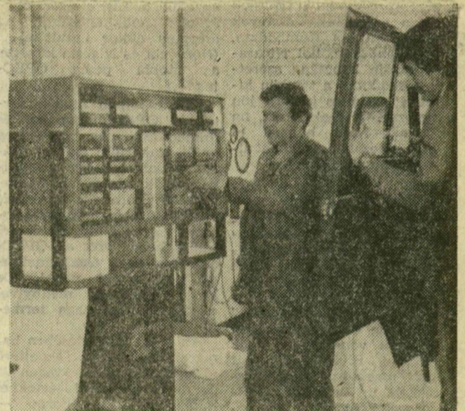
„Adj gázt s megmondom, nagycikád 7357-B” — a 120 ezer forint értékű műszer ilyen okos...

Szolgáltatásaik sorát ismerjük már az autók, kocsimosásra, zsírásra, alkatrészt nem igénylő javításokra azok közül is sokan odajárnak, akiknek egyébként a Tolbuhin sugárúti szerviz típuslistáján szerepel az autómárkájuk. A két szerviz közti munkamegosztást az ésszerűség diktálta: valamennyi gépjárműtípus javítására berendezkedni, alkatrészeket raktáron tartani nem, gazdaságos. A leányvállalatnak ebből a felismerésből kellett kiindulnia, s a 3,5 millió forintos forgóalapot a szovjet és lengyel személykocsik a jugoszláv Zastavák és a szovjet kisteherkocsik alkatrészeinek beszerzésére kellett szánnia. Ez az összeg egyébként nem sok — mit van mit tenni,