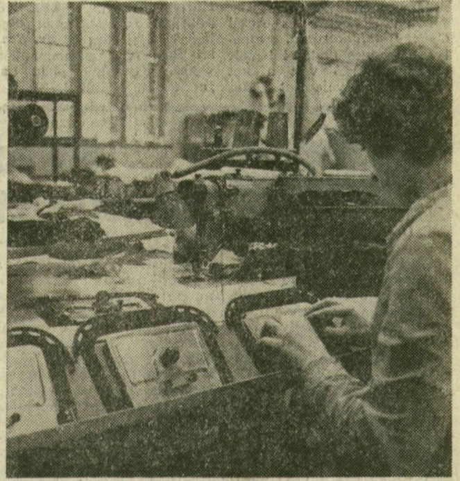
Az NSZK-ból érkezett az Adler gyártmányú zsebfedőkörülvarró gép, amely a megfelelő minta behelyezése után óránként 300 darabot varr, gyorsabban, pontosabban, mintha kézzel irányítanák a munkadarabot

Aki szép ruhát, öltönyt tud készíteni, bizonyára örömmel végzi munkáját, de ki tagadná, hogy zsebet, gomblyukat varrni egy egész műszakon át fárasztó, unalmas. A Szegedi Ruhagyár műszaki gárdája sok újítással, ötletes szerkezettel segíti elő a könnyebb, pontosabb munkát, s ha kell, külföldről is beszerzik az ehhez szükséges gépeket. Képeinken ezekből mutatunk be néhányat.