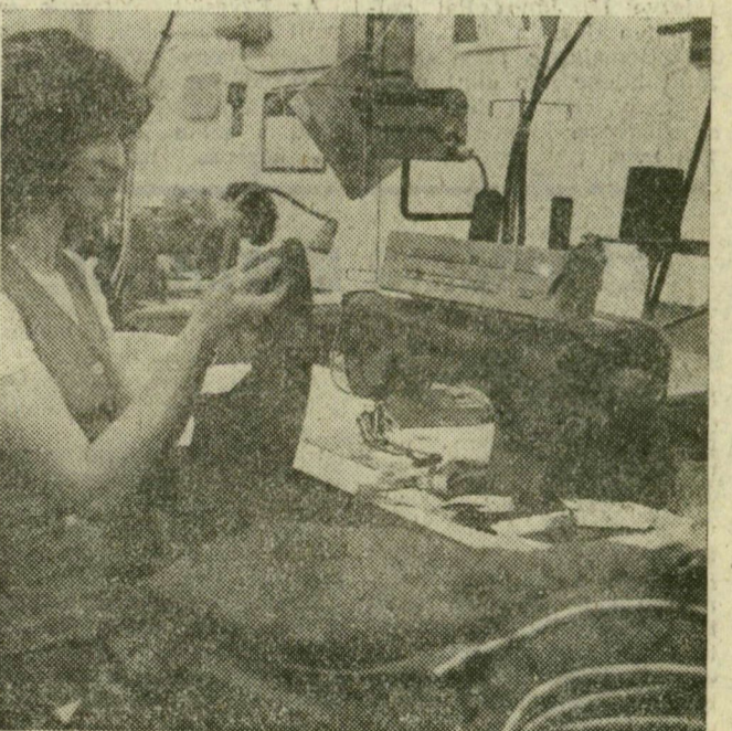
A programvezérléses ujjbehúzó gép egyenletesen ráncolja a kabát ujját, a kézi fércelés lassúbb, szabálytalanabb volt. A Pfaff-gyártmányú, ötletes gép az NSZK-ból érkezett