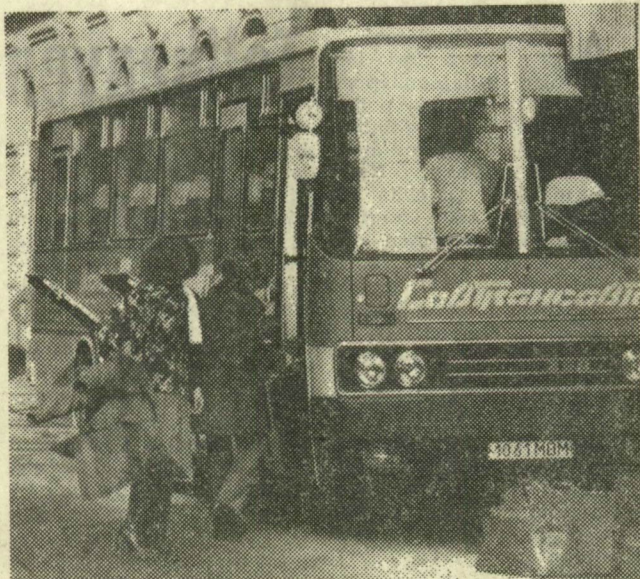
Kár, hogy nem maradtunk tovább!

Talán, majd ha a külföldieknek támasz kedvük egy-egy huszáros vágára, biztos akad pénz patronálója is a szatymazi lovaglásnak. Addig csak a sóhajok nyargalására számíthatunk.