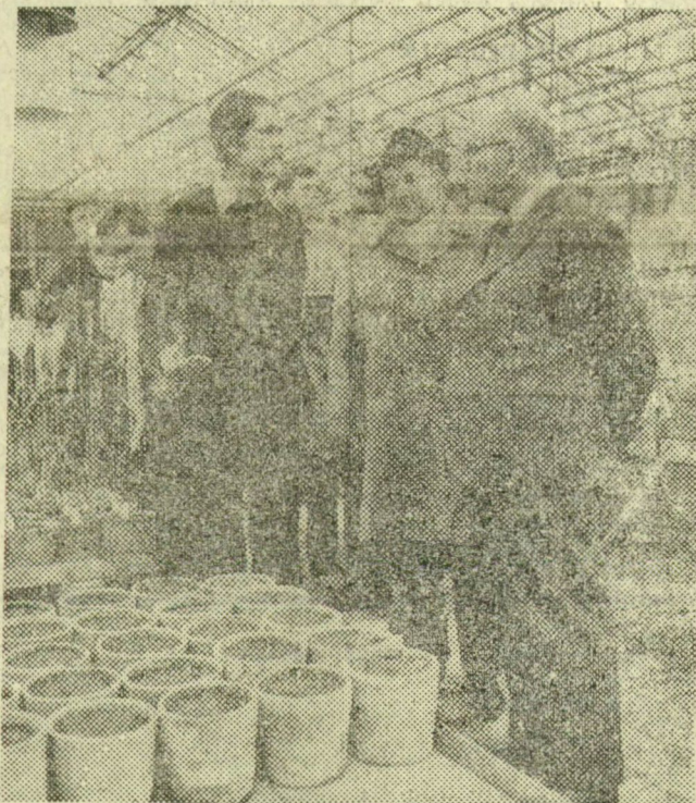
A vendég a GKI üvegházában megtekinti a nemesítőmunkát

Az ipari termelés üteme lassult az elmúlt években, egyidejűleg tavaly a mezőgazdasági termelés az országos átlagot meghaladóan 6 százalékkal emelkedett. A mezőgazdasági üzemekben a földkihasználtság javult, kevesebb volt a parlagterület, s az eszközkihasználtság is hatékony. A megye az exportra való termelés tekintetében jelentős eredményeket ért el, bár az 1982-es exportcélokat nem sikerült maradéktalanul teljesíteni.