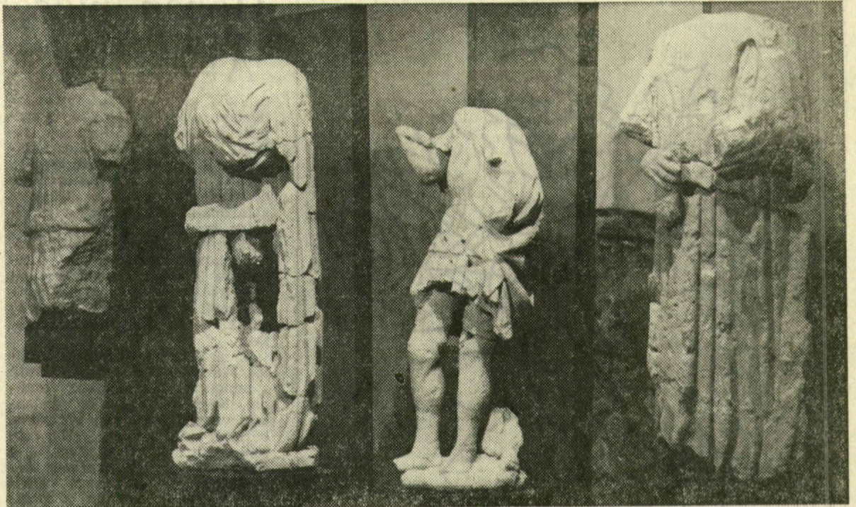
A vitatott eredetű gótikus szoborlelet

Nehéz szerelemben véres születésben taníts hűségre gyönyörű nagy tében boríts el véle iszad atkával ökölben mosdatott késben fűrészelt vértiszta hónapú emeli magadhoz