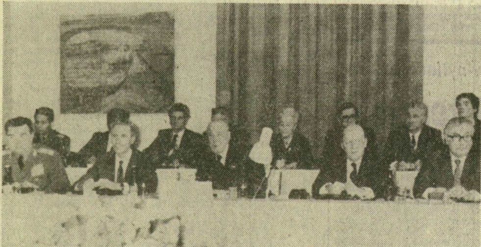
A Kádár János vezette magyar küldöttség a tanácskozáson.

Keddén délelőtt a prágai várban megnyílt a Varsói Szerződés Politikai Tanácskozó testületének ülése. Az ülésen a jelenlegi nemzetközi helyzetről, a béke megőrzéséért, a nukleáris háború veszélye és a fegyverkezési hátsza ellen, az envhülesi folyamat folytatódásáért, valamint az európai biztonság és együttműködés erősítéséért vívott harc legfontosabb kérdéseiről tárgyaltak.