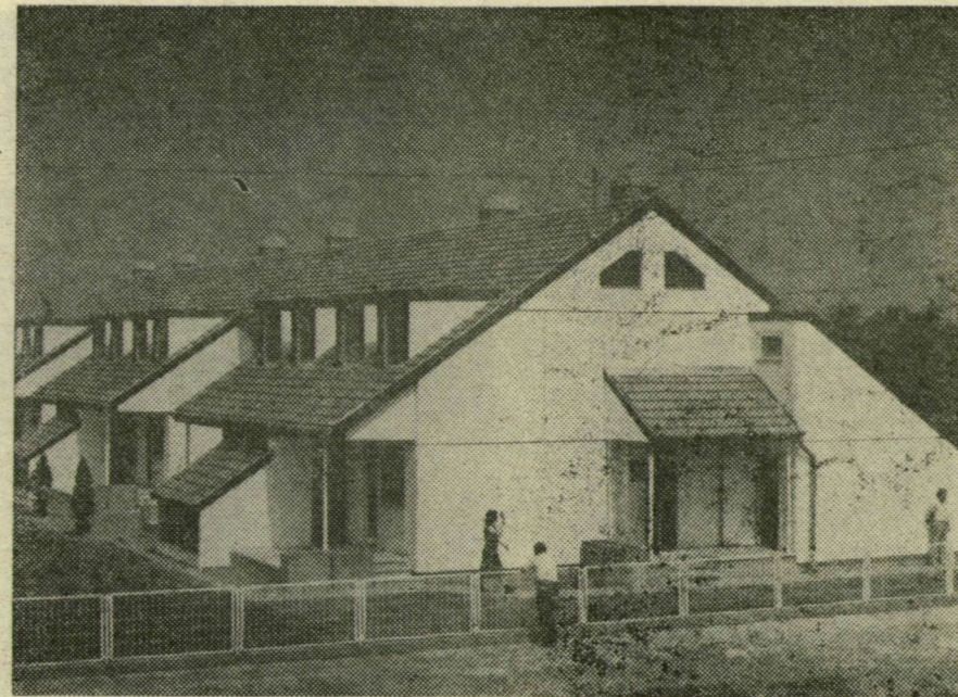
Házgyári panelből családi házak épülnek Újszegeden

Az egészségügyi, szociális ellátottság is tovább javult. A terveknek megfelelően épült egy 80 férőhelyes