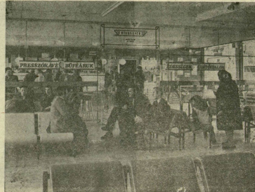
Átadták rendeltetésének a szentesi autóbussz-pályaudvar épületét

6. A közlekedési teljesítmények a beruházási és nemzetközi tranzitszállítások visszafogottsága, valamint a fuvar- és viteldíjak emelése