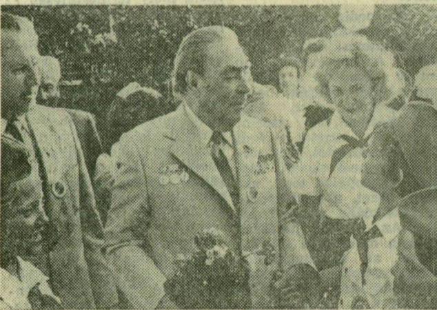
Úttörők körében az artyeki úttörőtáborban