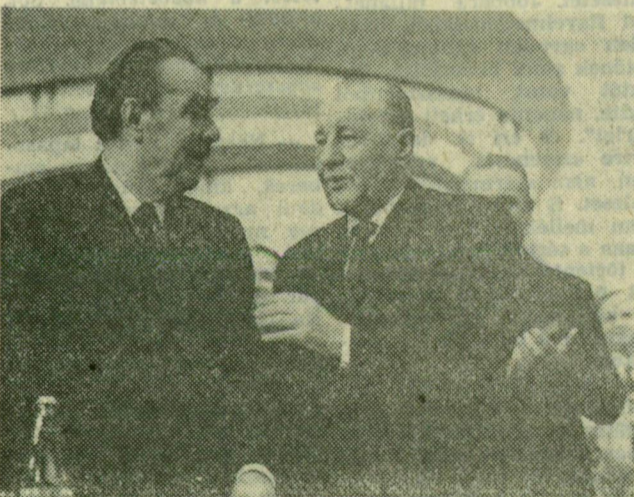
Leonvid Brezsnyev és Kádár János az MSZMP XI. kongresszusának elnökségében