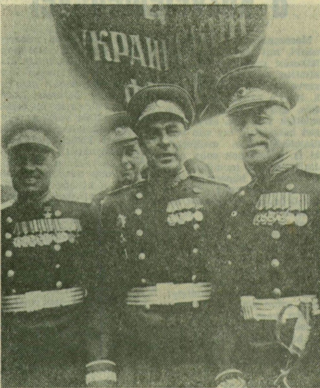
Bresznev (középen) 1945. június 24-én, a Vörös téren tartott győzelmi díszszemlén

Nem szűnik a gúsz. Ezek és ezek búcsúznak Leonvid Brezsnyevtől aki életét népe, s az egész emberisége békéjének, haladásának szentelte. Kéneink a aadaa életút néhány eseményét mutatják.