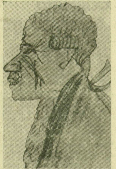
Gulácsy Lajos: Juhász Gyula, mint francia márki

Gulácsy Lajos 1909 őszén, Nagyváradon, „... a színes és hangos nagyvárosban, ahol a Holnap született, kollektív kiállítás rendezett régi és új műveiből, és akkor kerültünk közrelebb egymáshoz. Bevezető előadást tartottam róla az ünnepléses megnyitáson, amelyre ő a dán királyfi kosztümében és karddal az oldalán akart megje-