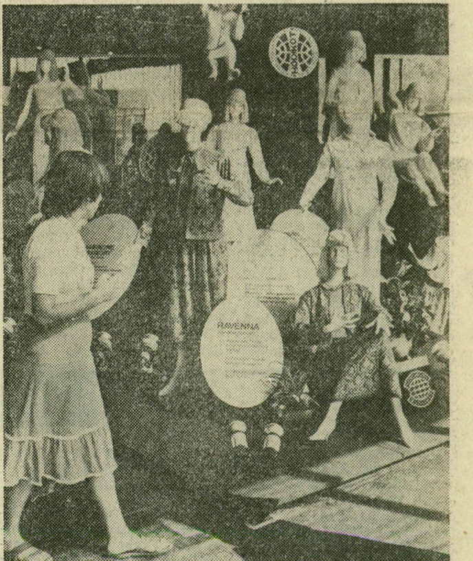
A Hódmezővásárhelyi Divatkötöttáruvári termékeit aligha kell külön is minősíteni. A vásárlátogatók legfeljebb annyit megjegyeztek tetteik az A pavilonban, amikor megnézték szép cikkeiket, hogy „Miért nincs ezekből több a hazai üzletekben?” Elégítsék ki a vevők igényeit — csak ennyit mondhatunk a fogyasztók nevében

A fogyasztók díját öt termékcsoport legjobbjai kapták: a Békéscsabai Konzervgyár rostos gyümölcslektárája és zöldesítála, a Debreceni Kötöttáruvári Rítmus '82 terméksaládja, a Graboplast Farmutszövő és Műbörgyári Grabotina Lux/C bútor- és üléslektárája, az Alföldi Porcelángyári Blanka neűy étkészlete, valamint a Caola Kosmetikai és Háztartásvégypari Vállalat Timea kozmetikum családja.