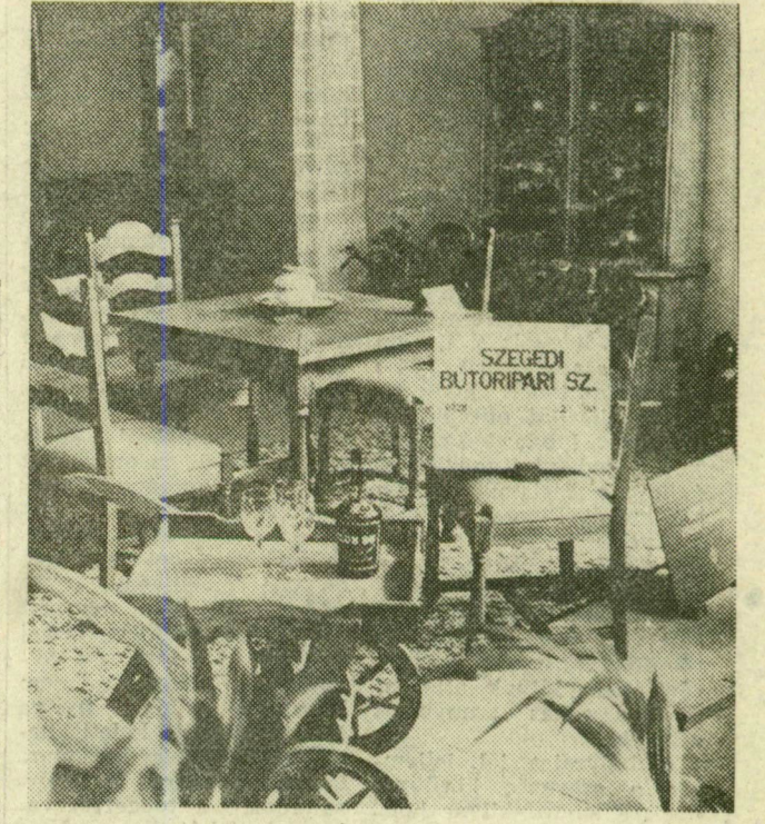
A Szegedi Bútortipari Szövetkezet egy ebédlőgarnitúrát mutatott be. A székek és az asztal szép vonalvezetése és minősége megnyerte az érdeklődők tetszését