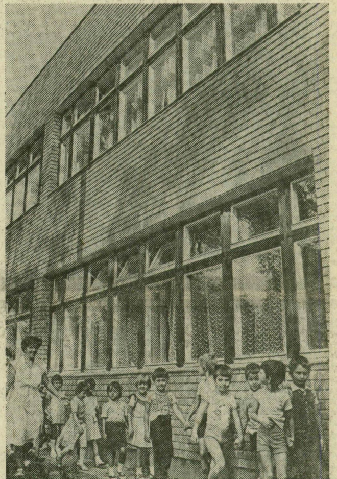
Kisgyerekek ind ulnak óvodájukba