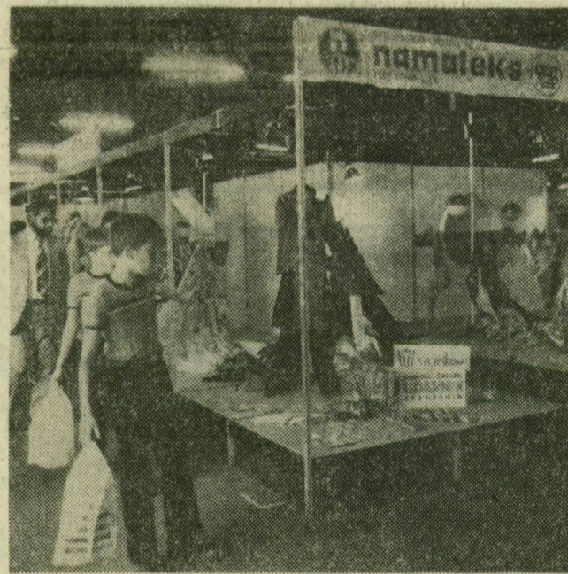
A közönség nagy érdeklődéssel kíséri a Namateks cég bemutatóját

A tegnapi, hétfői napon még több eseményről is hírt adtak a vásár rendezői. A lengyelországi Lódz kiállítói elmondták, hogy az áruházi cserék keretében 40 ezer rubeles üzletet kötöttek a Szeged Nagyrúház és a Lódzi Textilipari Külkereskedelmi Vállalat képviselői. Szakmai napok keretében találkozott partnereivel a Makói Vas-és Fémipari Szövetkezet, a Győri Kötöttkesztyűgyár, a DELKER és a budapesti Reklámszövetség. A vásár-igazgatóság ajándékokat adott az ötvénzredik látogatóknak.