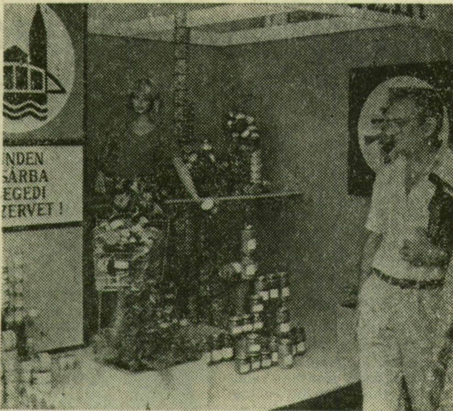
A Szegedi Konzervgyár termékei.

Es persze közben olvadt a vásár fűtőjében az aszfalt. Ezen az úton bandukolva hallottam egy véleményét: ez a vásár valóban forró siker. A férfiú persze egy pavilonhoz igyekezett, ahol korsós sört mértek. Sokan álltak meg, hogy megcsodálják a Szegedi Sz