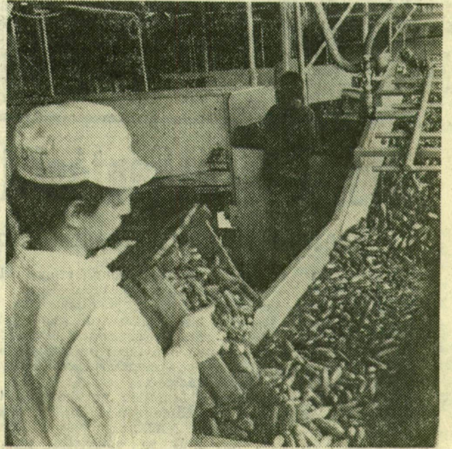
Futószalagra kerül a gyárba érkező friss áru

Három műszakban dolgozzák föl a beérkező nyersanyagot, naponta átlag 7 vagon uborka érkezik a gyárba. Teljesen automatizált gépsorokon készül a savanyúság. Képeink ezt a folyamatot mutatják be.