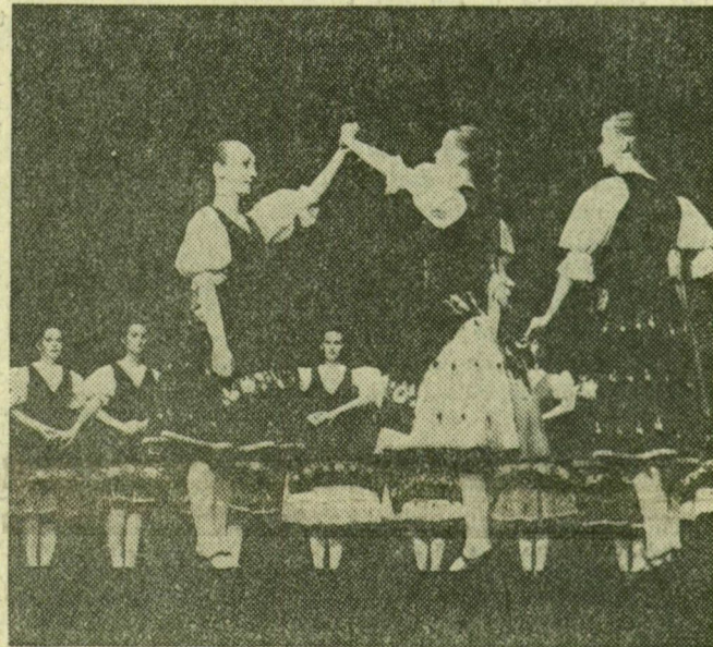
Nyíregyházi táncosok a Kisszínház színpadán

együttese; második fokozatát szerzett a kaposvári Somogy Táncgyűjtés; harmadik fokozatát a Csepel Táncgyűjtés. Az ezüst minősítés első fokozatát kapta a pápai Textiles-Téglás Vadvirág, a soroksári német nemzetiségi és a Vasutas Törekvés Táncgyűjtés; második fokozatát érdemelt ki a szegedi DÉLÉP Napsugár, a tatabányai Bánnyász és a veszprémi Építők Bakony Táncgyűjtés. Bronz fokozatát kapott a debreceni 127. számú Szakmunkásképző Intézet, a herendi Építők, a nagykanizsai Vasutas, valamint a nyíregyházi KSZDSZ Szabolcs-Volán táncgyűjtése. Két néptánc-csoport nem szerzett minősítést.