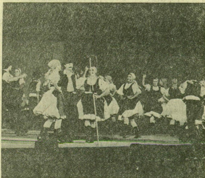
Nagy sikere volt a Bartók táncgyűjtés tagjainak az újszegedi bemutatón