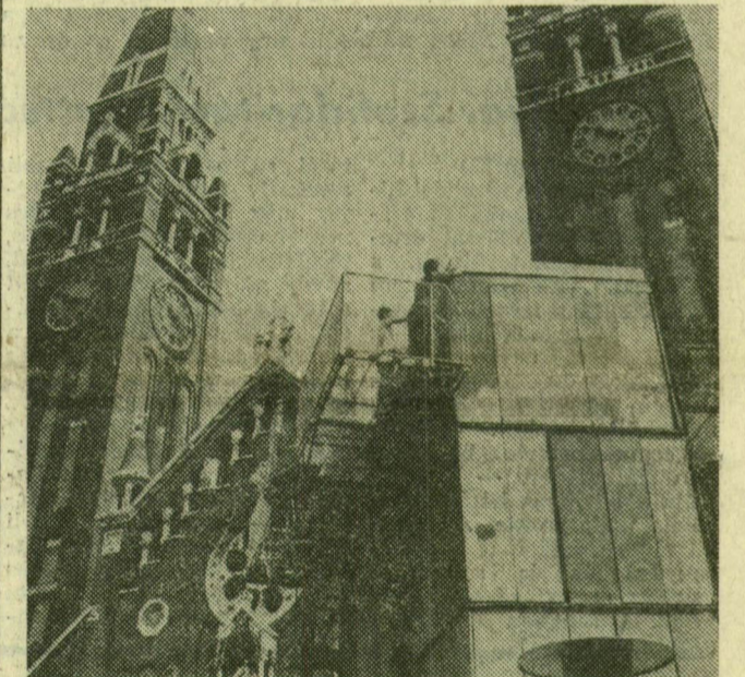
Festők dolgoznak a világszítótorny tetején.

Hetek óta folyik már a munka a Szegedi Szabadtéri Játékok színhelyén. Ácsok, festők, szerelők készítik elő a színpadot és a nézőteret az ünnepi hetekre. A Csonád megyei Építőipari és Szolgáltató Szövetkezet szakmunkásai dolgoznak itt, újrafestik a világszítótornyokat, megerősítik a nézőtér vasszerkezetét.