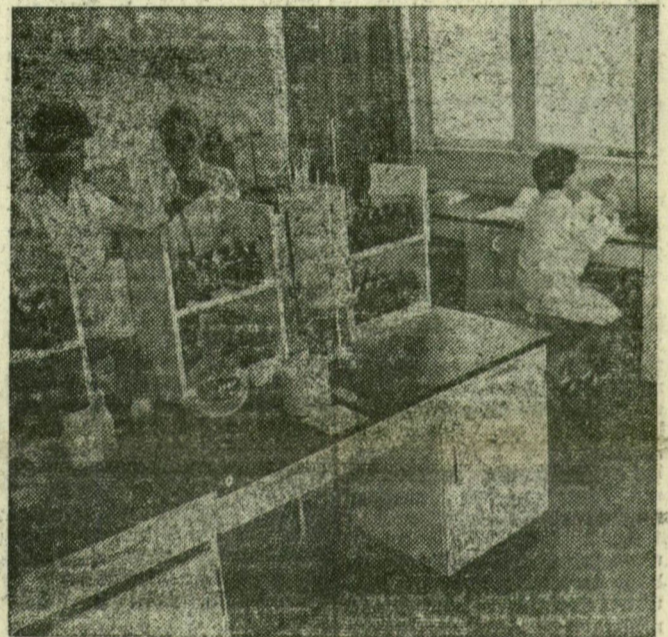
A szakfelügyeleti laboratórium egy részlete