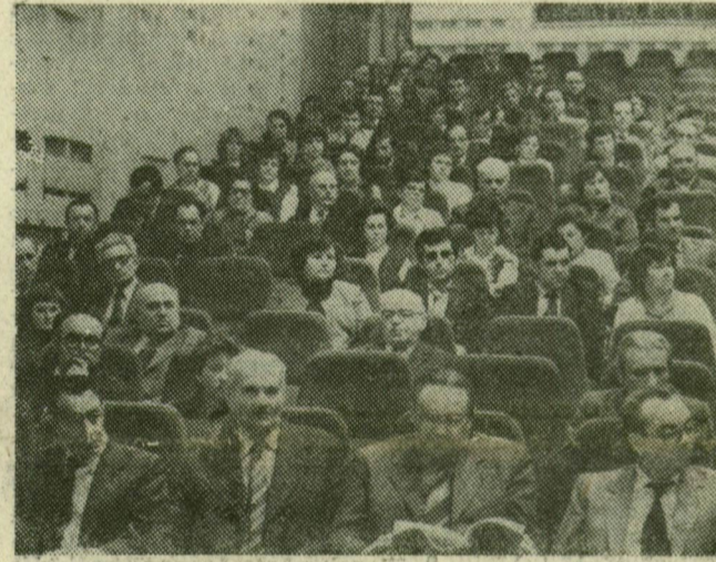
A küldöttek egy csoportja a közgyűlésen

A vendéglátó egységek forgalma a terveknek megfelelően alakult. Javult az üzemi étkeztetés helyzete, ám változatlanul kívánivaló hogy maga után — különösen a kisebb településeken — a melegkonyhai készítmények választéka. A kisfalvak éttermeiben máig jóformán eszi, nem eszi, nem