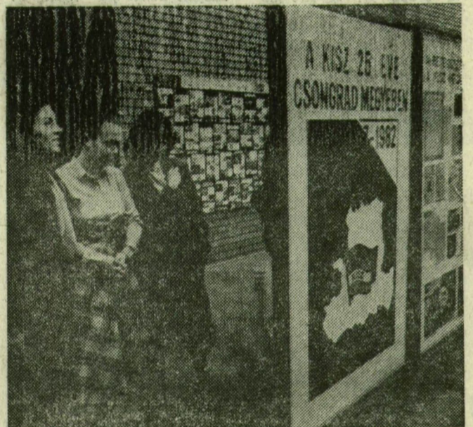
A dokumentumkiállítás első látogatói