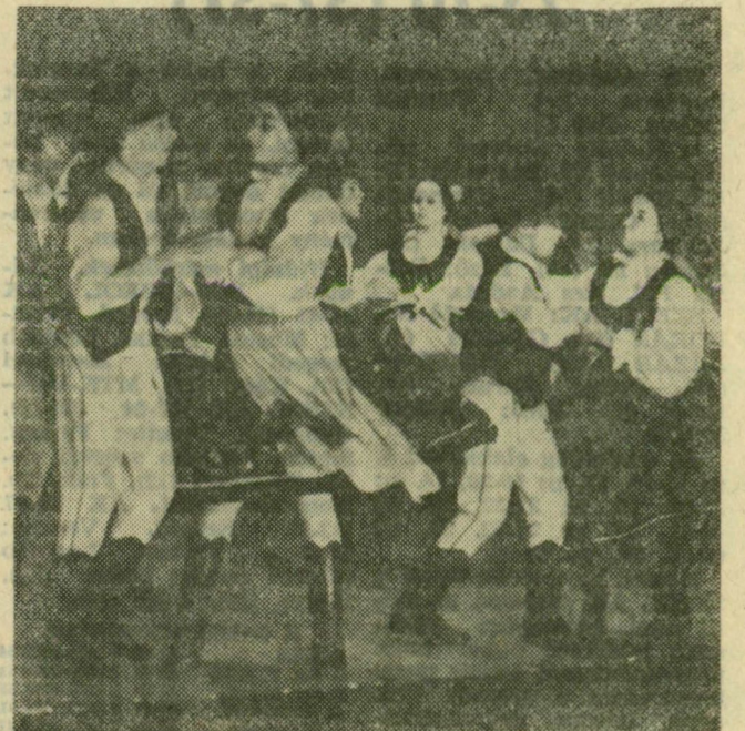
Részlet az üllésiek műsorából

Nagy sikerű néptáncműsor volt szombaton este az üllési művelődési házban. A Néptáncosok Dél-Alföldi Tanácsa és a Csongrád megyei Továbbképzési és Módszertani Intézet néptáncosok bemutató sorozatát indította el, amelynek keretében az első folklórműsort Kecskeméten tartották a közel múltban. A sorozat második programján, Üllésen rendkívül nagy érdeklődés kísérte az együttesek — a kecskeméti megyei művelődési központ táncgyűlése, a vaskútj német nemzetiségi