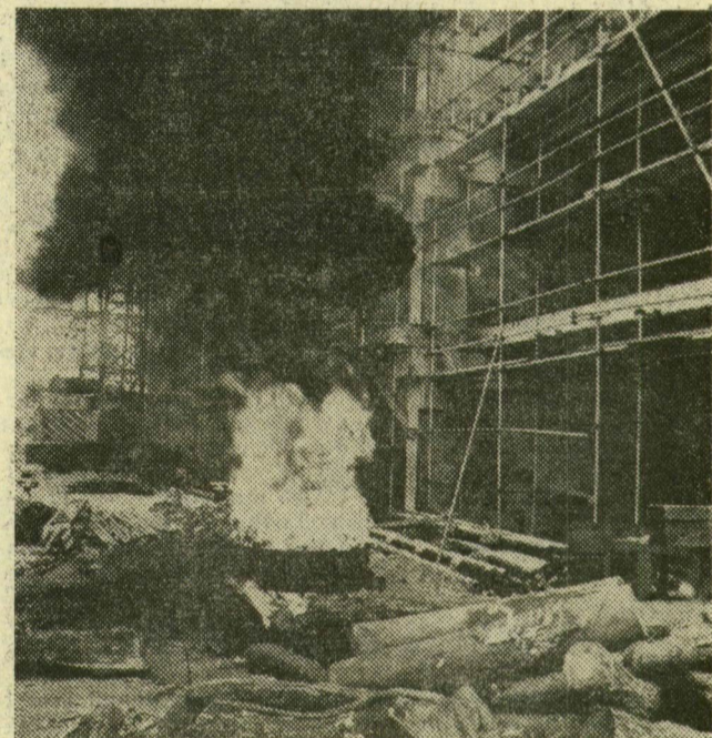
Olvasszják a bitument a szigeteléshez. Nagy hidegben melegedőhelynek is alkalmas a tűz környéke.

Kivülről úgy látszik, nem történik semmi különös az épülő szegedi könyvtár környékén, de odabent minden szinten dolgoznak a részben téli üzemeltetésű épületben. Január 4-e óta a DELEP Árpád vezér szocialista kőműves brigádjának tagjai tevékenykednek itt, az alagsorban szigetelést és szigetelésvédő betonozást végeznek, az emeleteken pedig a belső válaszfalak merevítő acél-szerkezeteit helyezik el. Ugyanitt dolgoznak a Budapesti Fém munkás Vállalat munkásai, akik a függönyfalakat szerelik.