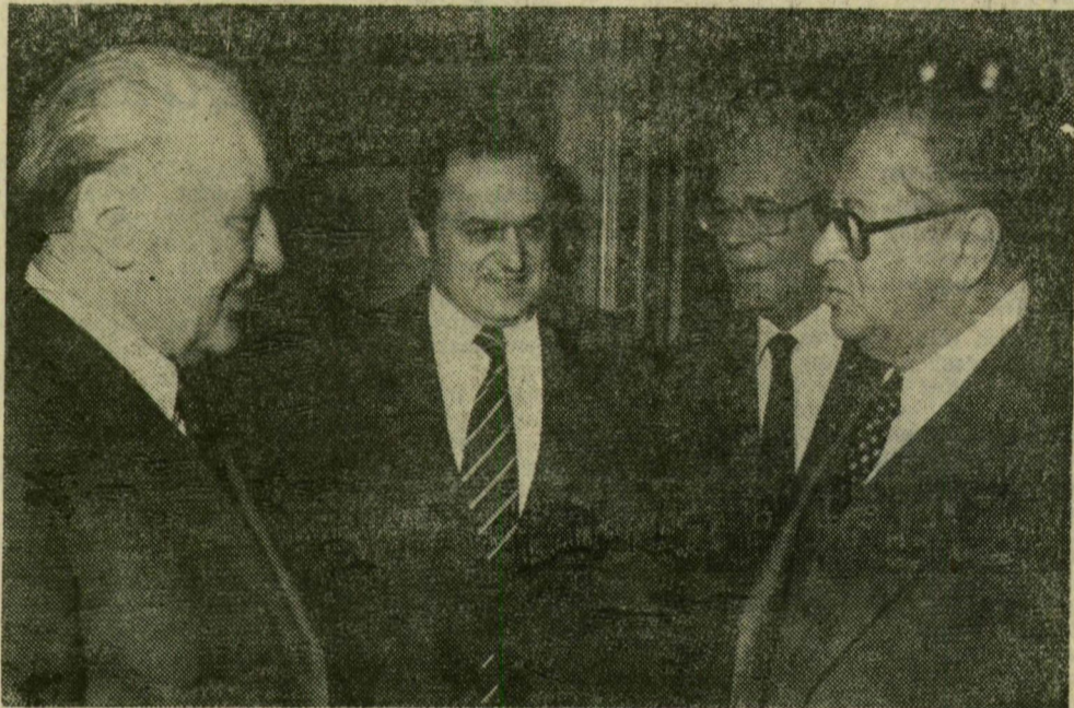
Kádár János találkozott Bruno Kreiskyvel.

Kádár János és Losonczy Pál fogadta az osztrák kormányfőt – Közös közlemény a látogatásról