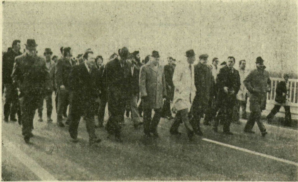
Az ünnepség vendégei, hidépítők gyalogosokként avatták fel a hidat

Már 1977-ben elérte átbo-csátó képességének felső határát a század elején épült, s azóta javított közös közúti-vasúti híd a 451-es úton, a Szentés és Csongrád közötti Tisza-szakaszon. Hatszáz jármű haladhat át rajta óránként — érthetően hosszú kocsisor áll hát a lezárt sorompók előtt, ha vonat érkezik a híd felé: a jelentős teherforgalmú út-szakaszon ennél jóval több a jármű, már ma is. A közúti és a vasúti forgalom kettéválasztására négy évvel ezelőtt új Tisza-híd építéséhez kezdtek hozzá, hat-száz méterrel délebbre a régitől. Kétsávos, két olda-lon gyalogjáróval szegélyez-tett úttestjén tegnap, hét-főn délután megindulhatott a közúti forgalom. Elkészült ugyanis az UVATERV mér-nőkeinek elképzelése alap-ján az új szentes—csongrá-di Tisza-híd, amelyen órán-ként 1800 jármű haladhat át.