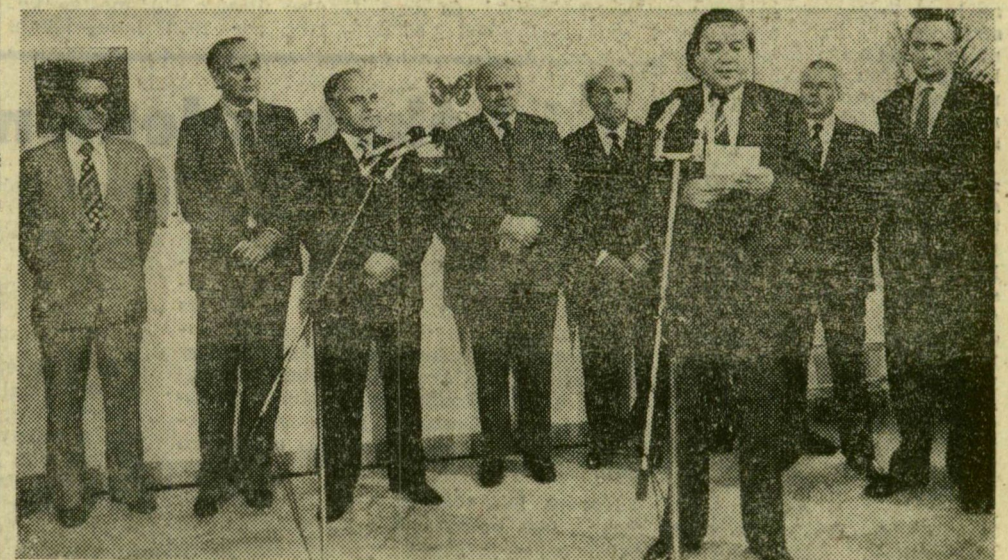
Pozsgay Imre megnyitó beszédét mondja.