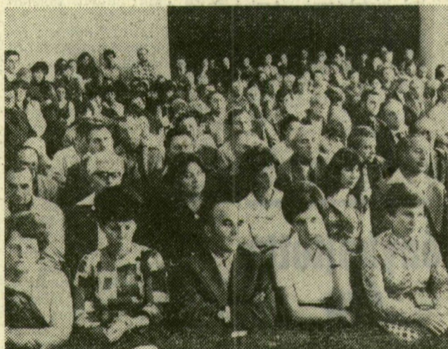
A szegedi eseményen résztvevők egy csoportja