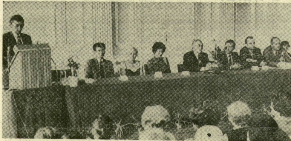
A szegedi értelmiségi gyűlés elnöksége.

Szeged szellemi életének képviselői, az egyetemek és főiskolák tanárai, tudósok, tudományos kutatók, írók és képzőművészek — együttesen mintegy háromszáz — gyűltek össze csütörtökön a József Attila Tudományegyetemen.