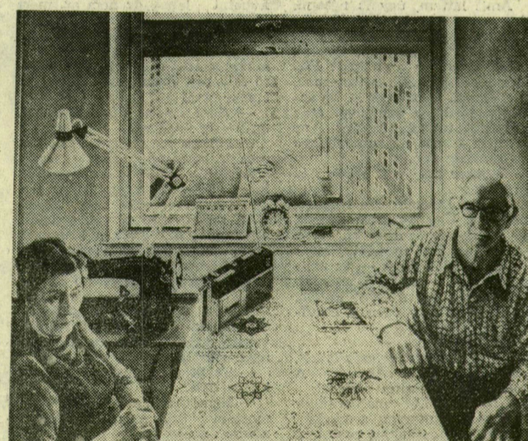
MAROSVÁRI GYÖRGY SZÜLEIM CÍMŰ ALKOTÁSA