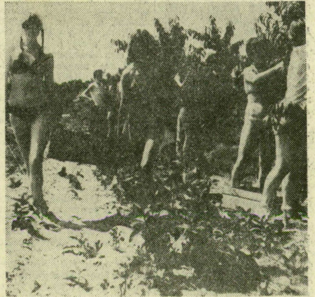
Az ötfőnösi Magyar László Tsz-ben diákok szedik az őszi-barackot