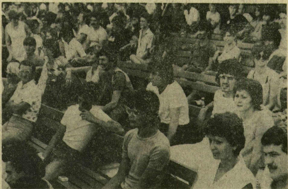
Fiatalok egy csoportja az újszegedi szabadtéri színpad nézőterén.

„Köszöntjük a 15. Szegedi Ifjúsági Napokon résztvevő fiatalokat” - harsogta tegnap délután a lemezlovas mikrofonja úgy két óra körül a Tisza-parton, a lépcsőkön, parkányokon ücsörgőknek. Hogy szegedieknek vagy vendégeknek, nem lehet tudni. Egy biztos: az Expressz szervezésében megérkeztek tegnap a csoportok, különvonatokkal, busszokkal, ki hogy tudott. Borsodból 580-an, Komáromból 300-an, Nógrádból 134-en, Szabolcsból 200-an, a fővárosi Expressz igazgatóságától 420-an. Felsorolni is sok lenne, hiszen az ország valamennyi megyéjének fiataljai képviseltetik magukat. Számítá-