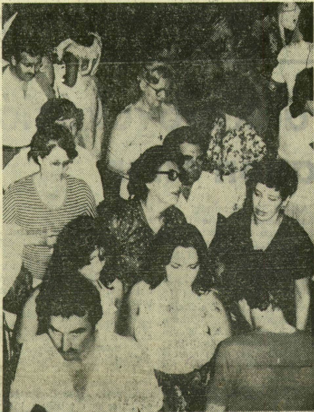
Gyülekeznek a premier-közönsége

„Szeged híres város” — a hagyományos fanfárhangok tegnap, szombaton este a felújított Szegedi Szabadtéri Játékok huszonharmadik szezonjának nyitányát jelezték. A Himnusz elhangzása után a nézőtér népes közönsége az orosz nemzeti opera első klasszikus alkotásában gyönyörködhetett: a Moszkvai Nagyszínház szólistái és alkotóművészei Mihail Glinka: Ivan Szuszanyin című operáját mutatták be. Az orosz nyelvű előadás rendezője, Vagyim Milkov, a realiztikus elemeket mellőzve a mű általános érvényű mondandójára helyezte a hangsúlyt. Ifjú kortársja, a díszletek és jelmezek tervezője, Viktor Volszkij ehhez a rendezői koncepcióhoz jelképes díszletet készített — egy szimbolikus, mozgó ikonosztázt az orosz világ szimbolikus elemeivel: harangokkal, hagymakupolákkal, ikonparafraízisokkal, az oly sokszor megénekelte tajga végtelenségét sugalló faágakkal, gyertyafüzérekkel. Két világ, két kultúra egymásnak feszülését érzékeltette rendezés, díszletkompozíció, színészi játék.