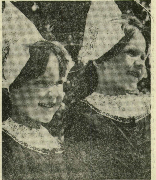
A Szegeden először szerepelt holland együttes legfiatalabb tagjai

A VIII. nemzetközi szakszervezeti néptáncfesztiválon szereplő külföldi együttesek idén is sajátos színeket hoztak Szegedre nemze'ük, népük tánc kultúrájának, népi hagyományvilágának bemutatásával. Holnap, vasárnap, és holnapután, hétfőn előbb a népművészeti vásáron, este pedig a Dóm téri gálaesteken viszontláthatja mindnyájukat a közönség.