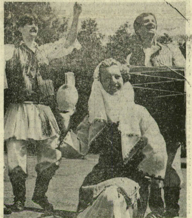
Táncol: a jugoszláv Zeljezara Zenica-együttes