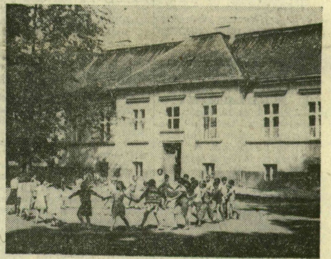
A volt Pallavicini-kastélyban is tanítanak