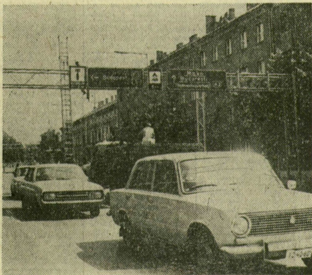
A KPM új táblái a Nagykörúton