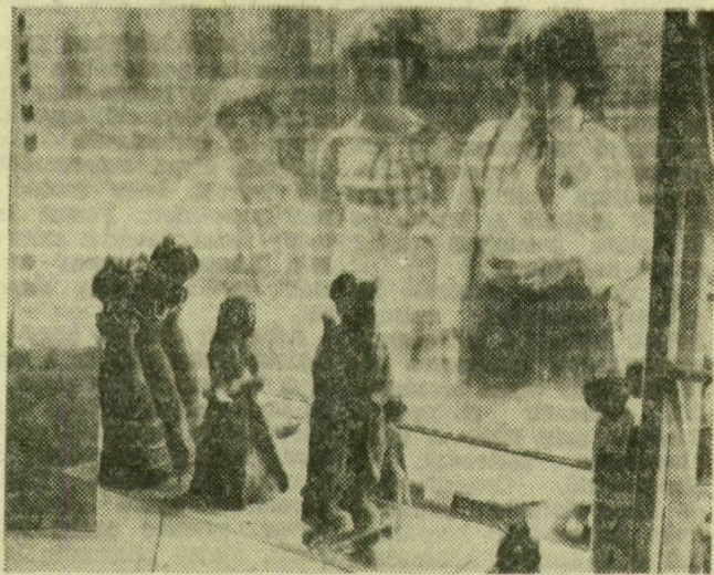
Bartók-zenék és Balázs Béla-művek ihlette kerámia- és üttörőház szakkörének tagjainak munkái — az idegen nyelvű könyvesbolt kirakataiban

Az ünnepi könyvhét első napjaiban sokan keresték föl a tizenhárom pavilonnal könyvtérre alakított Dugonics tere, a zenélő szökőkút környékét, vajamint a könyvesboltokat, alkalmi árusítóhelyeket. A vásárlók körében különösen nagy sikere van a féláru kiadványoknak, a kortárs szerzők műveinek, elsősorban Moldova György, Hernádi Gyula, Kolozsvári Grandpierre Emil új könyveinek. A vásárnapi gyermeknapon sok szülő vásárolt a gyermek- és ifjúságirodalom ünnepi kínálatából. A szegedi rendezvénysorozat mai központi eseménye A zene könyve című, világot