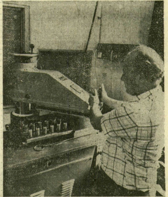
Automata. A szabászaton dolgozik. Sok ember munkáját helyettesíti. A gyár újító készítették

Évente négyszer tartanak ötletnapot. Nincs óriási dologról szó. Egy-egy termelőhelyen munkaidő után megkérdezik a dolgozókat, hogy szerintük mit és hol lehetne ésszerűsíteni. Az eredmé-