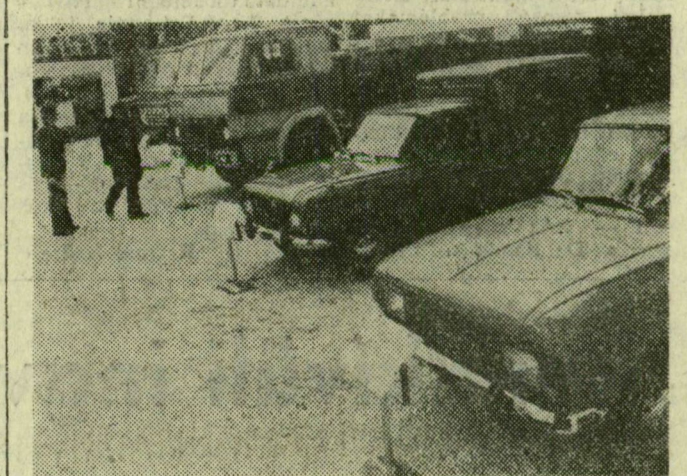
A KAMAZ autógyár legújabb teherautói is megjelentek a BNV-n, s a hasznos, kis mennyiségű teher szállítására alkalmas Moszkvies autókát ugyancsak láthatnak az érdeklődők a szabadtéri bemutatón