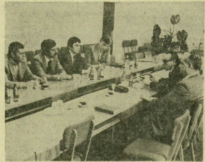
A szabadkai vendégek — balról — a városi pártbizottságon.