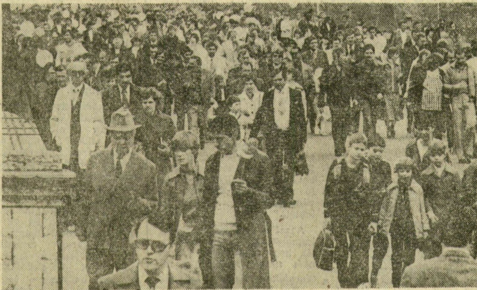
Az ünnepség után sok ezren indultak az újszegedi majálisra

Az életszínvonalnak a védelmét azzal is törekedtünk biztonságossá — a realitás tenni, hogy a korábbi ötéves tervektől eltérően a nemzeti jövedelemből fogyasztásra fordítható rész aránya most nagyobb. Az V. ötéves