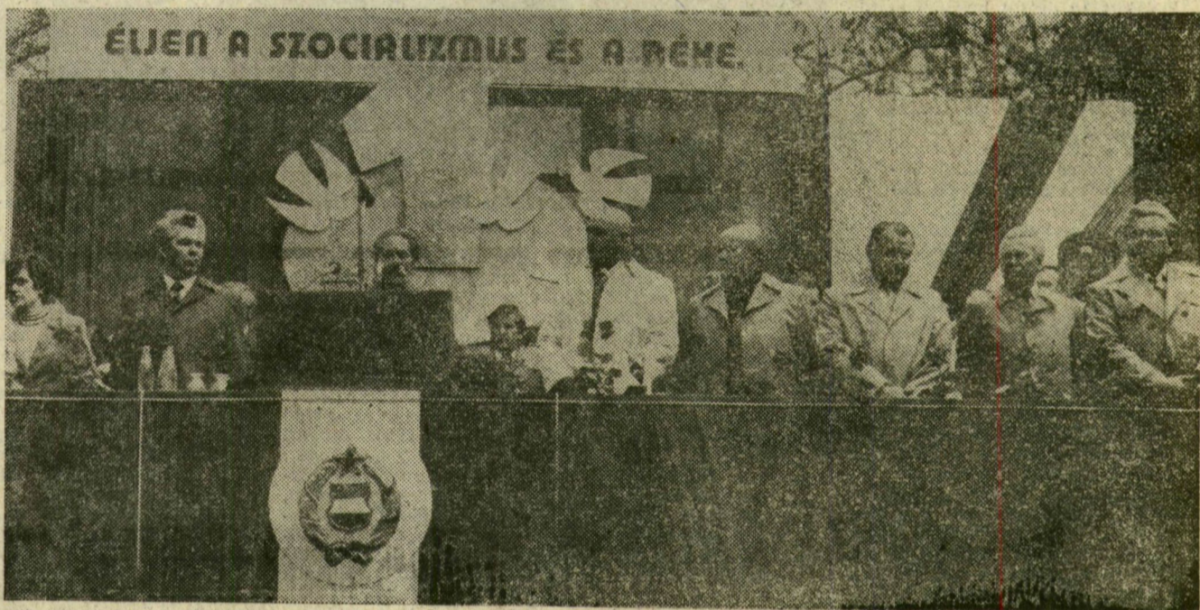
A szegedi ünnepi nagygyűlés elnöksége

Május elsején sokéves hagyomány immár: Szeged lakói zeneszóra ébrednek. Reggel 6 óra után három zenekar járta a város utcáit kedvesnialó muzsikával. A korán ébredők most némi aggodalommal tapasztalhatták, csepereg az eső. Mindez azonban nem szegte kedvét az ünnepelő szegedieknek, akiknek többsége nem sokkal a vidám ébresztő után, elindult a májusi seregszemle gyülekezőhelyeire. Ünneplőbe öltözött emberektől tarkállottak a szegedi utcák. A felnőttek zászlókat, a gyermekek színes léggömböket vittek. Zsúfolásig teltek a városközpont felé tartó autóbuszok is. Sokan kelték útra a város környéki községekből is, hogy meghallgassák az ünnepség szónokát, majd utána ellátogassanak a majális színhelyére, az új-szegedi ligetbe.