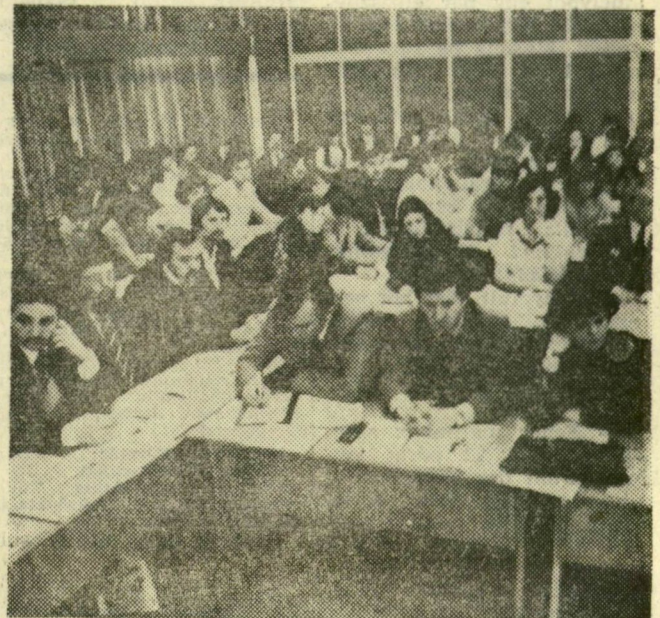
A küldöttgyűlés résztvevői a vitát hallgatják