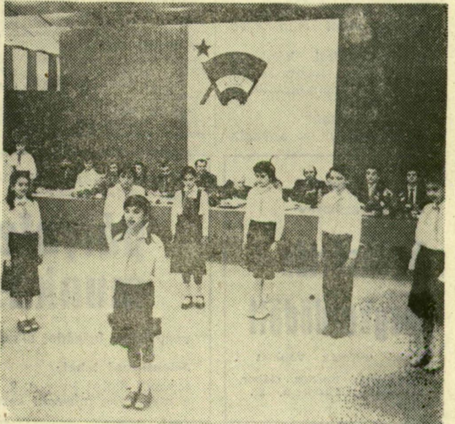
Úttörők köszöntik daltal „idősebb testvéreiket”