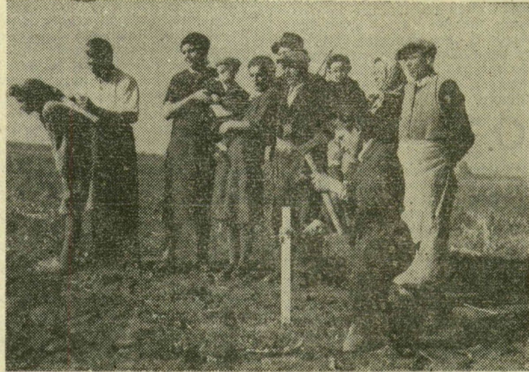
1945. március, valahol az Alföldön: Azoké lesz a föld, akik megművelik