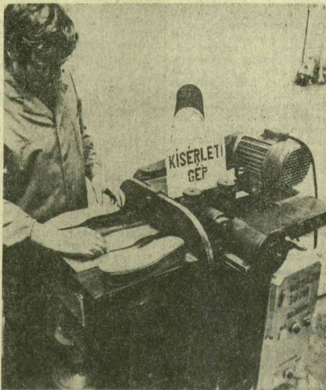
Talpcsiszoló gép, egyhatod áron – saját konstrukcióban