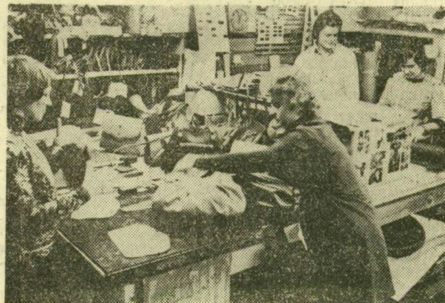
Készülnek a női divattáskák

Ehhez a zavartalan anyagellátás alapvető követelmény. A Graboplast az év első heteiben elmaradt az anyagok szállításával, emiatt is keletkezett némi lemaradás. Tökés exportra szállítottak egy tételt a termékeikből — szűkös határidővel. A szövetkezet dolgo-