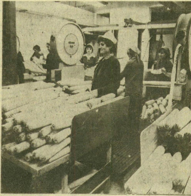
Szovjet exportra készítik elő a szalámit a csomagolóban

A gyár tavaly ünnepelte fennállásának 30. esztendőjét. A termelési érték először haladta meg az 1 milliárd forintot. Bizakodva tekintenek a jövőbe, annál is inkább, mert jól tudják, a célok elérésében a munkaverseny is segíti majd őket. Céljuk az, hogy termékeik kifogástalan minőségűek legyenek, hiszen az éles versenyben csak így tudnak talpon maradni. A vállalat dolgozói — amint azt vállalásaik is jól mutatják — átérik e követelmények fontosságát. Helytállásuknak, s a vállalatnál kibontakozott munkaversenynek köszönhető nyilvánvalóan az is, hogy komplex minőségi mutatóik alapján évek óta az iparág három legjobb vállalata közé tartoznak. Mostani vállalásaik ahhoz is hozzájárulnak, hogy ezt a helyüket megtartsák.